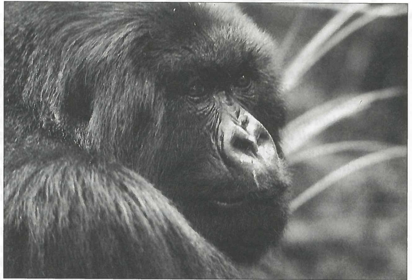
Berggorilla im Parc National des Volcanos in Ruanda. Über eines der letzten Reservate dieser faszinierenden Tiere erzählt Walter Zörer in seinem Vortrag über Ostafrika.